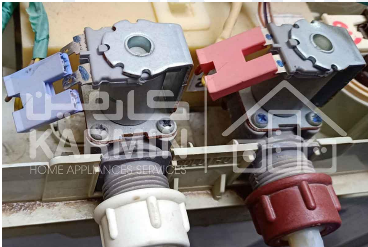
تعویض راحت و آسان شیر آب ورودی